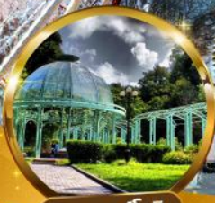
สวนบอร์โจมี