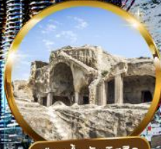
เมืองดำ อพัลิสสิค